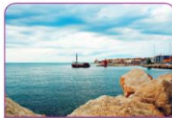
pokrajina ob morju