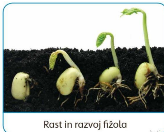
Rast in razvoj fižola