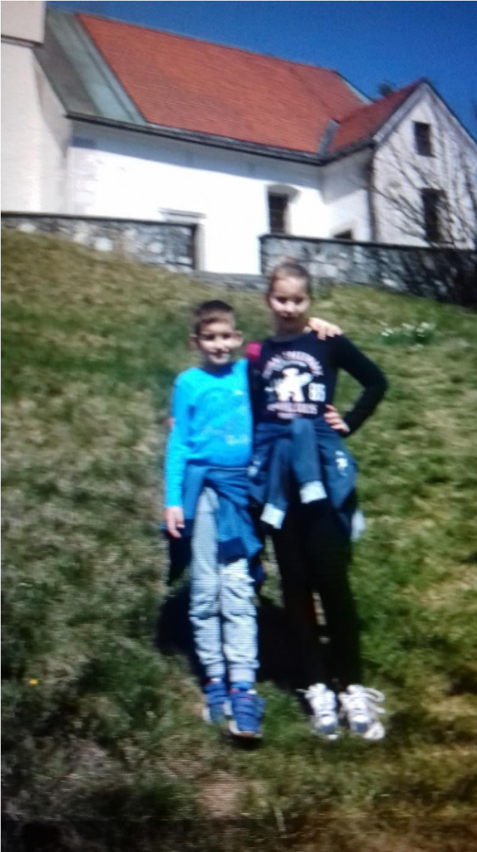
Slikanje pri svetem Lenartu.