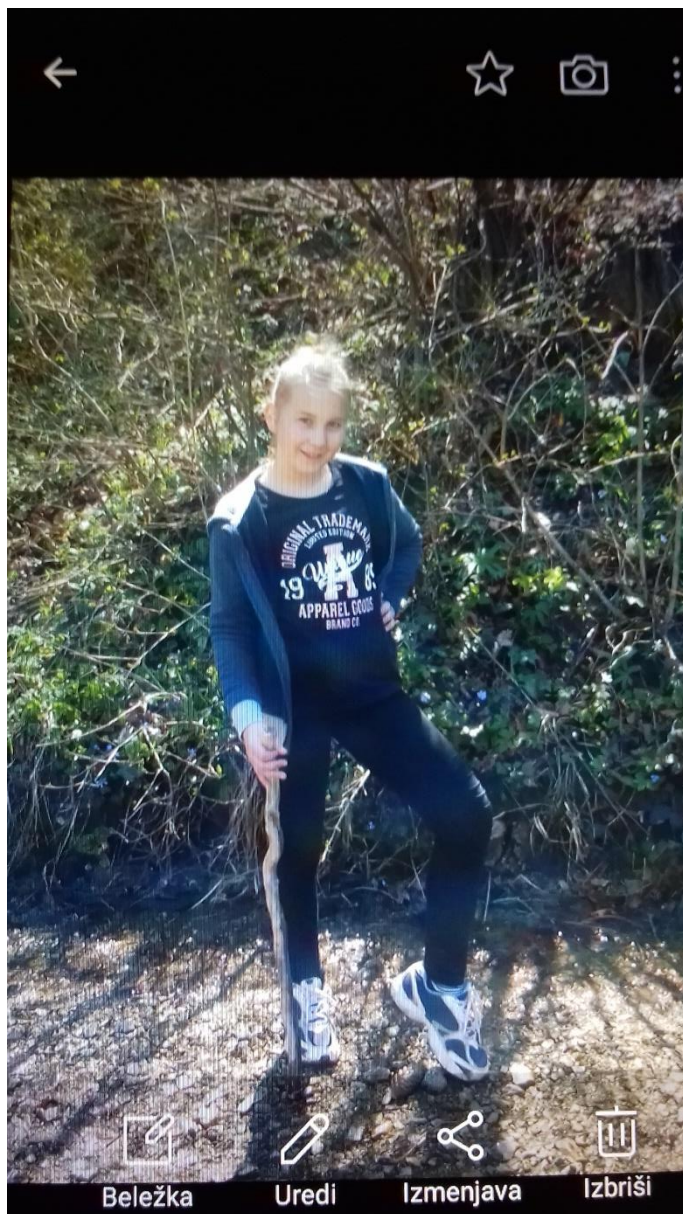
Slikanje pri potočku.